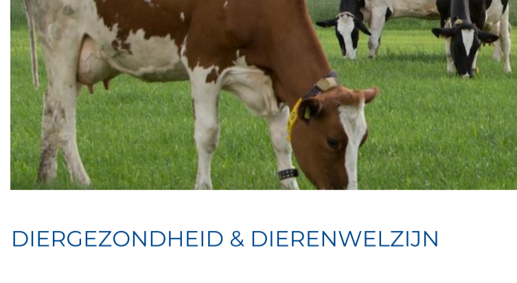
DIERGEZONDHEID & DIERENWELZIJN