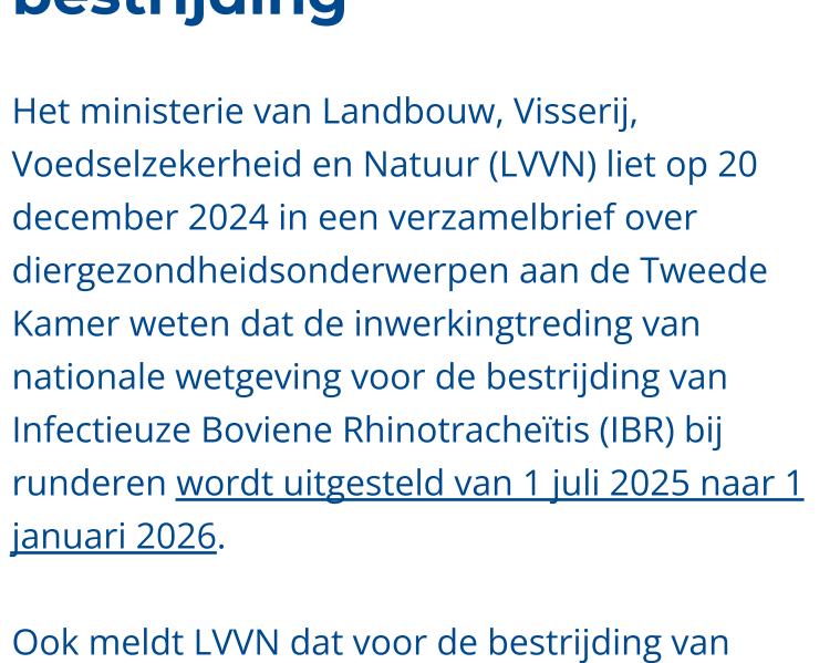
DIERGEZONDHEID & DIENENWELZIJN