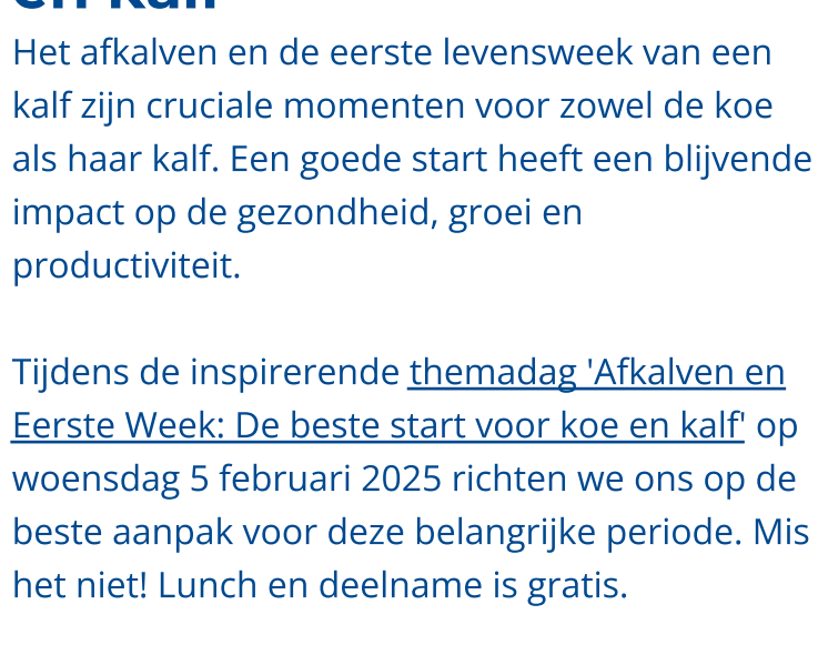
DIERGEZONDHEID & DIENENWELZIJN