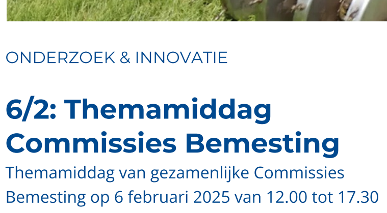
ONDERZOEK & INNOVATIE