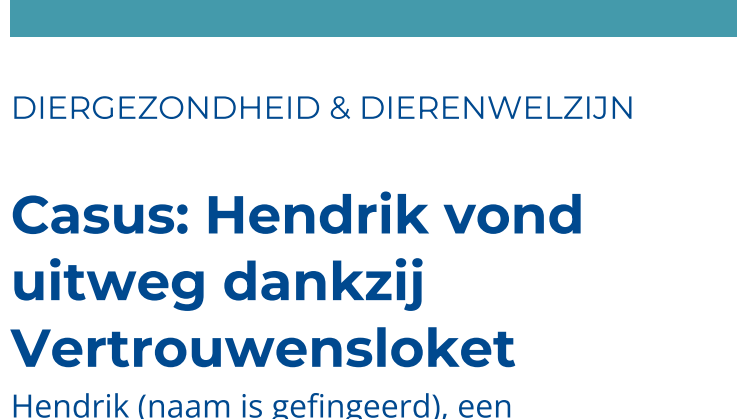
VERTROUWENSLOKET welzijn landbouwhuisdieren