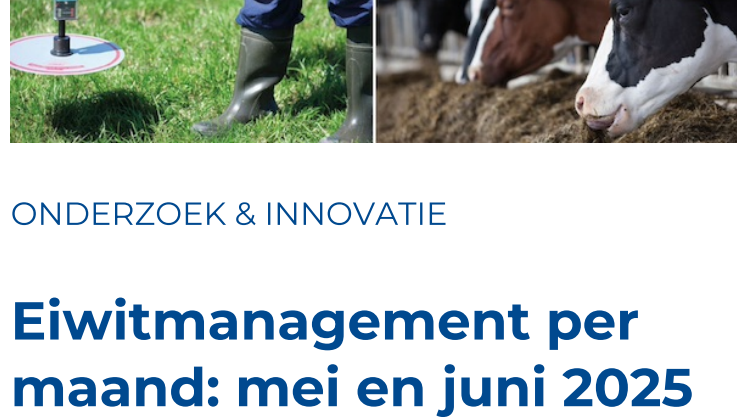
ONDERZOEK & INNOVATIE